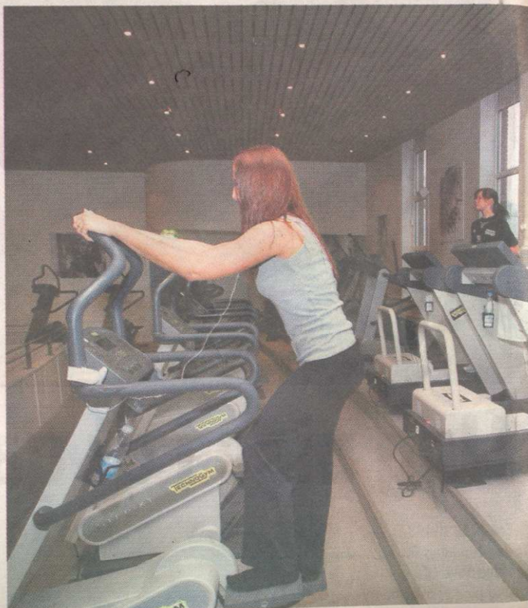
MOTION. Landets fitnesscentre oplever en øget interesse for deres maskiner i januar måned.

Af andre nytårsforsætter er det ønsket om at have mere tid sammen med familie og venner, at hjælpe andre og få nedbragt sin gæld, der er blandt de mest populære.